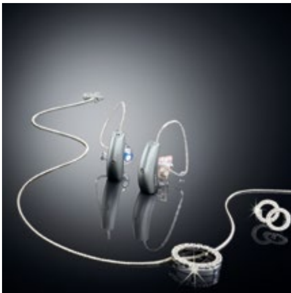
Widex Evoke PASSION RIC 10 Das welt kleinste Design-Hörsystem von Widex

Coral erhalten Sie exklusiv bei Ihrem HÖREXperten. Gerne beraten wir Sie und besprechen gemeinsam mit Ihnen, welches Coral Hörsystem am besten zu Ihnen passt.