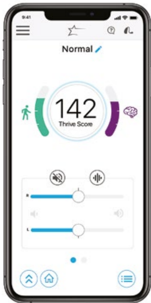
TF 9-2PLUS und Thrive Hearing Control App

Diese und viele andere ebenso innovative wie praktische Features manifestieren einen Quantensprung, der aus dem einstigen medizinischen Produkt einen modernen Begleiter für den digitalen Alltag macht. (hrx)